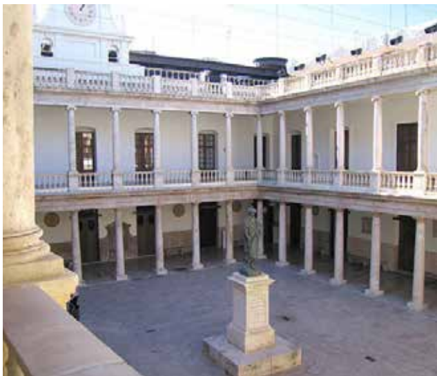
La Nau, claustre. Universitat de València-estudi General. En el ranking acadèmic ARWU-2015, ocupa un lloc que la situa entre les 301-400 millors del món, molt llunt dels primers llocs.

Tingam en compte la doble vertent humana: per una banda la individualitat i per a una altra la necessitat de viure en societat ; les dos son compatibles i necessàries, però hem de tindre les cauteles apropiades. Si bé la societat pot servir com un mig per a ajudar a la persona, també pot servir per a "oprimir-la". El tipus de societat que alguns governants (antics i nous) exerceixen és el del control i l'imposició, sense donar-se compte que només en