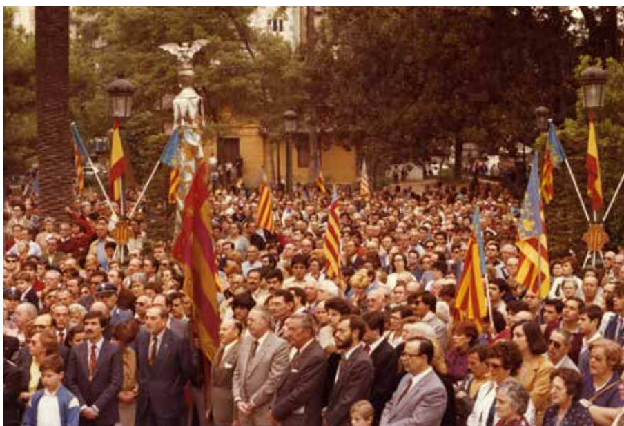
9 Octubre. Homenage a Jaume I en el Parterre, per Lo Rat Penat, 1985

Com podem vore, la processó i la festa del Nou d'Octubre és una celebració viva, que s'adapta als temps i a les corrents polítiques. L'última paraula sempre la tindrà l'Ajuntament de València, com a organisor de la commemoració. Pero la dinamisació de la festa és cosa de les entitats valencianistes, que, enguany fa cent anys, la varen crear, i són elles les que han de velar per a que el Nou d'Octubre no s'apague o es fossilise. Per a que continue sent la festa dels valencians. Són els valencianistes els que fan realment la processó, convertint-la en una expressió de la Valencianitat.