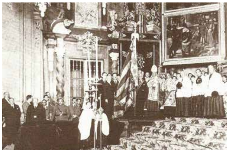
Acte de bendició de la Senyera, any 1928