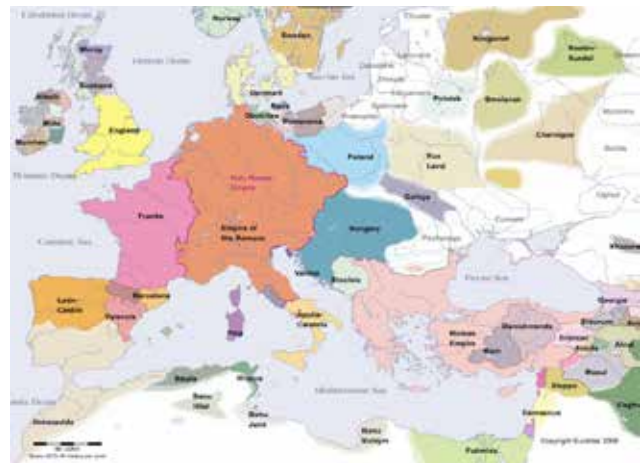
Europa, any 1100.

Confederal. Se forma per l'unió voluntària de territoris sobirans (estats) que no renuncien ad ella, de forma que continuen tenint plena capacitat legislativa i possibilitat d'abandonar la confederació de forma unilateral. L'unió dels estats se plasma en un document que bàsicament estipula la relació entre ells, i la legislació generada des del govern central s'aplica als estats, no directament als ciutadans, i se fa per acort entre els territoris. Són una confederació Austràlia i, la que tenim més pròxima, l'Unió Europea. Els USA ho foren fins la constitució de 1787.