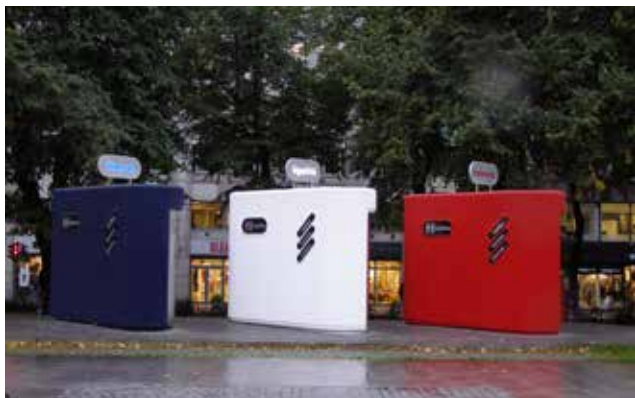
Karl Johan gates. Commemoració del Segon Centenari de la Constitució noruega 1814-2014.

9 d'octubre previ a unes eleccions estatals en les quals els valencians tindran opcions netament i estrictament valencianes. De la capacitat d'acert d'uns a l'hora d'oferir un programa homologable, en l'ambició d'arribar al 100% de la societat valenciana, i del discerniment de la ciutadania a l'hora de participar en una ferma travessa per un projecte sociopolític que nos ajude a créixer com a poble, depenen les opcions d'èxit. En les nostres mans, en les de tots, està la corresponsabilitat.