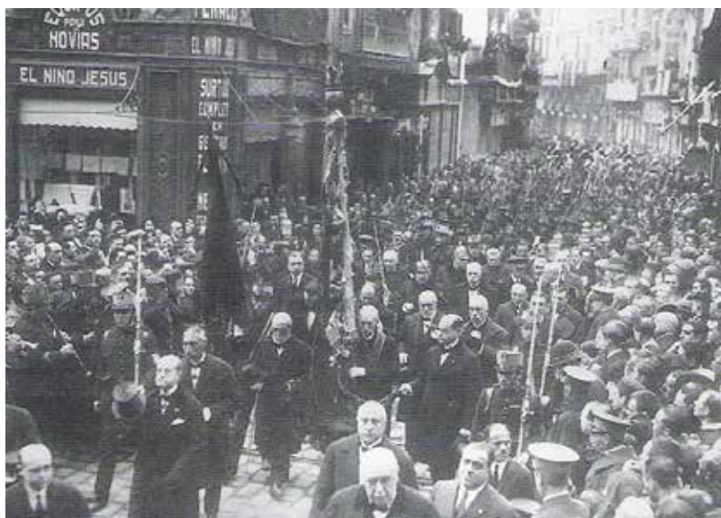
Processo Cívica. La Senyera, en el carrer Saragossa, a l'entrada de la Seu

Lo Rat Penat va seguir acodint a la processó en la seua Senyera.