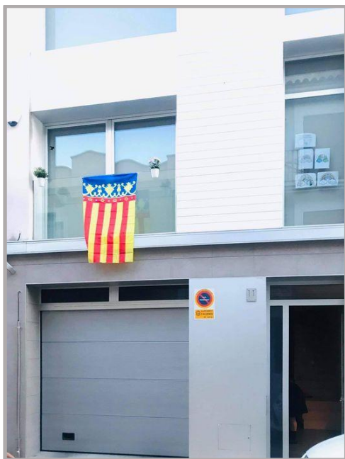
Foto d'Alicia Chambó, guanyadora del concurs "Senyeres al Balco" 2020. "Des d'Algemesi. Tots baix els plecs de la nostra Senyera "