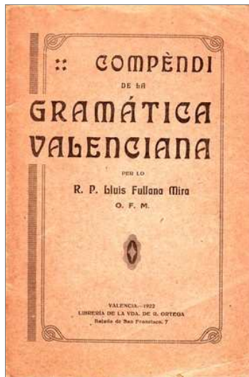
Compendi de la Gramàtica Valenciana, 1922