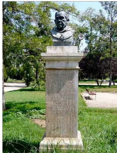
Monument a Fullana en els Jardins del Real, obra de l'escultor Rafael Orellano, sufragat pel GAV (1978)