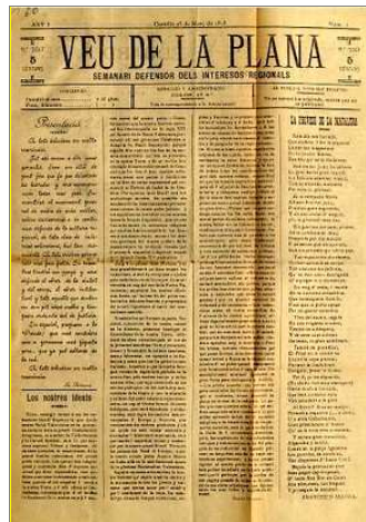
Numero 1 de la Veu de la Plana , semanari fundat per Gaetà Huguet en 1878