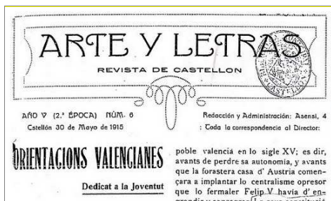
Capçalera de Arte y Letras , revista en la que Gaetà publicà les "Orientacions Valencianes", argumentari que dedica a la joventut valenciana. Castello, 1915