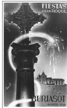
Cartell. Festes de Sant Roc. Burjassot, 1948