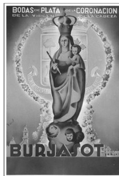
Cartell Bodes d'Argent de la coronació de la Mare de Déu de la Cabeza, patrona de Burjassot