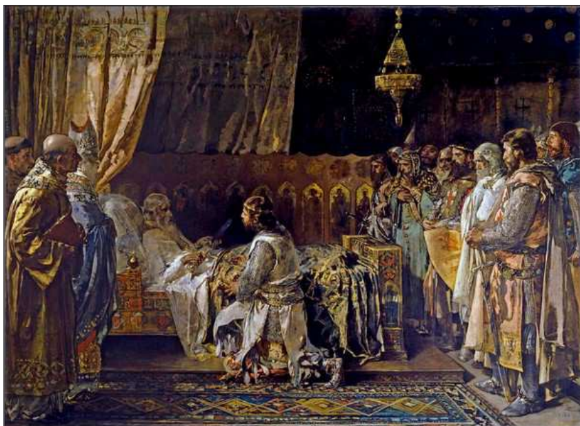
Ultims moments del rei Jaume el Conquistador en l'acte d'entrega de la seua espasa a son fill En Pere.

(Plaça de St. Lluís Bertran, València ciutat )