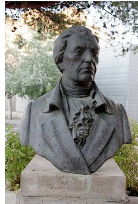
Bust del Dr. Balmis en l'Universitat "Miguel Hernández" d'Alcant

(Plaça de Tetuà, enfront al centre cultural Bancaixa. València c.)