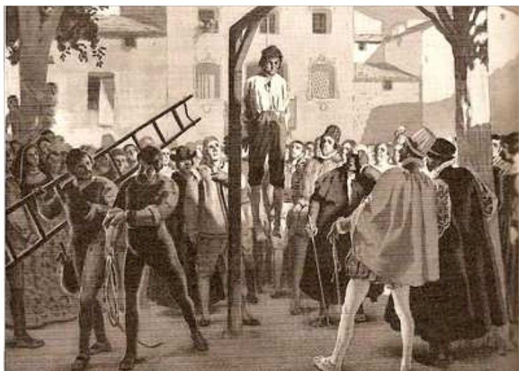
Eixecució de Guillem Sorolla en Xàtiva, 1522, de Josep Segrelles