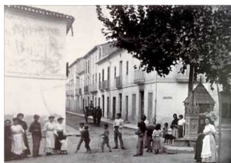
Plaça Redona (hui del Tenor Cortis). Dénia. A principis del segle XX

Tots els fulls de l'activitat Tots els dies 9 realitzades fins ara se poden trobar en pdf en: www.convenciovalencianista.org i www.rogleconstantillombart.com