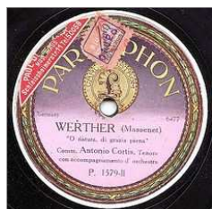
Disc d'una gravació d'Antonio Cortis